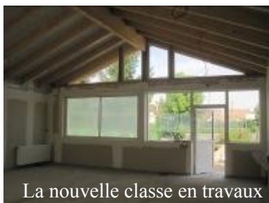
La nouvelle classe en travaux