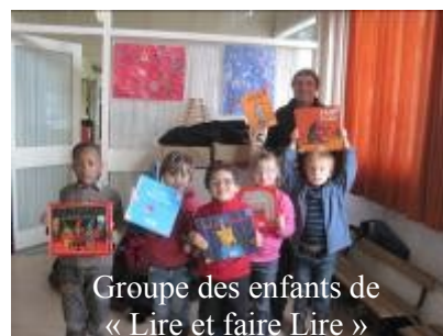
Groupe des enfants de « Lire et faire Lire »

Actuellement, un enseignant participe à un projet sur le thème du paysage proposé par le PNR (Parc Naturel Régional de la Haute Vallée de Chevreuse). Ce projet est plus précisément intitulé « plan paysage et biodiversité sur le plateau de Limours ». Un intervenant du PNR viendra 1/2 journée dans le courant de ce trimestre pour sensibiliser les enfants à ce thème ; puis ils devront réaliser un dossier qui sera présenté à la fête de l'Ecole du Parc, au mois de juin.