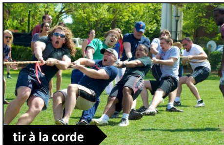
tir à la corde