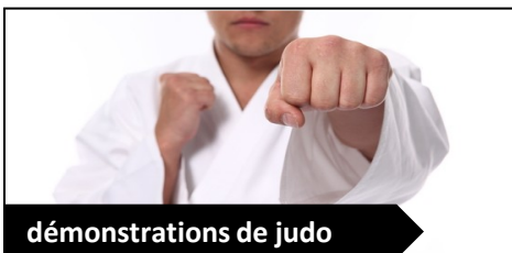
démonstrations de judo