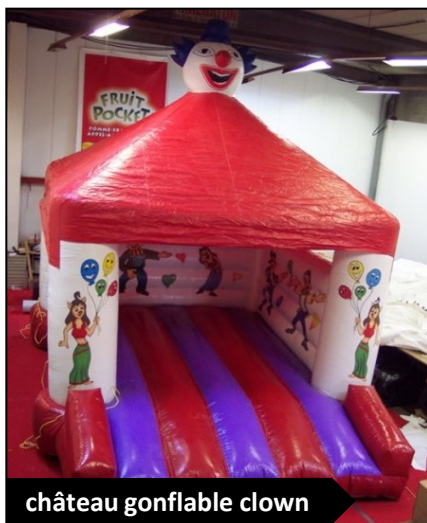
château gonflable clown