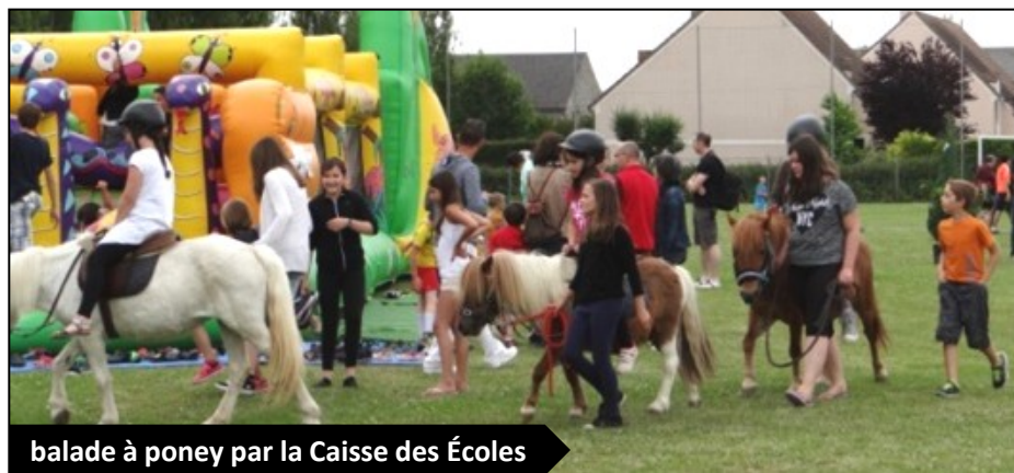
balade à poney par la Caisse des Écoles