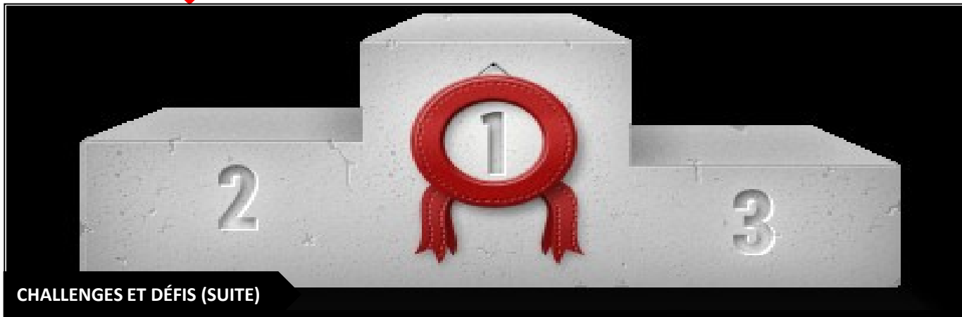
CHALLENGES ET DÉFIS (SUITE)