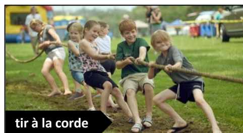
tir à la corde