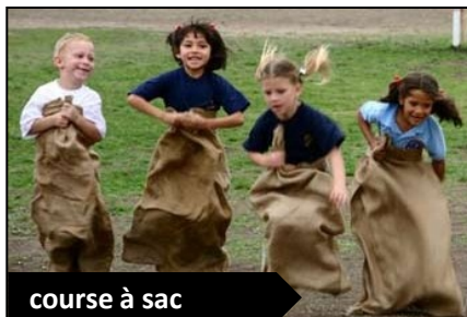
course à sac