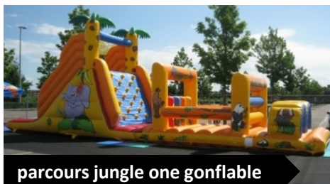
parcours jungle one gonflable