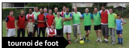
tournoi de foot