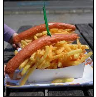
Menu saucisse/merguez frites