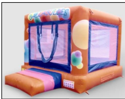
Piscine à balles