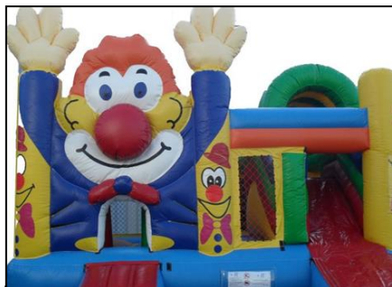
Château gonflable Cirque