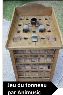
Jeu du tonneau par Animusic