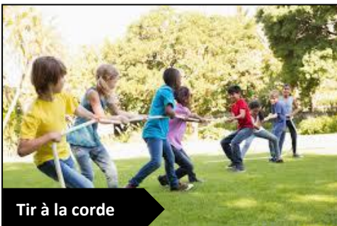
Tir à la corde