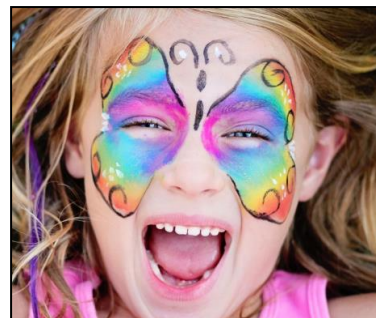
Maquillage par Animusic