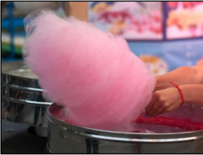
Barbe à Papa