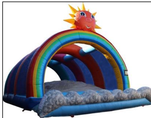
Dôme Arc en Ciel