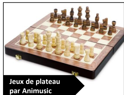
Jeux de plateau par Animusic