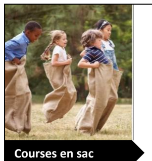
Courses en sac