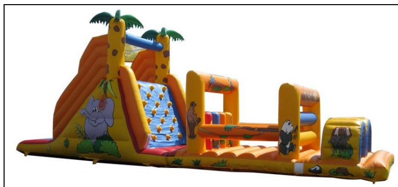
Parcours gonflable Jungle One