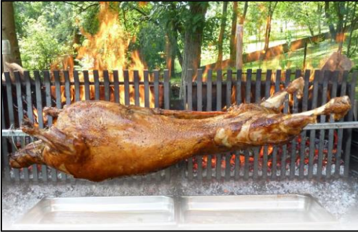
Menu méchoui mouton et pommes de terre